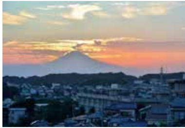
① 富士見小学校とその付近