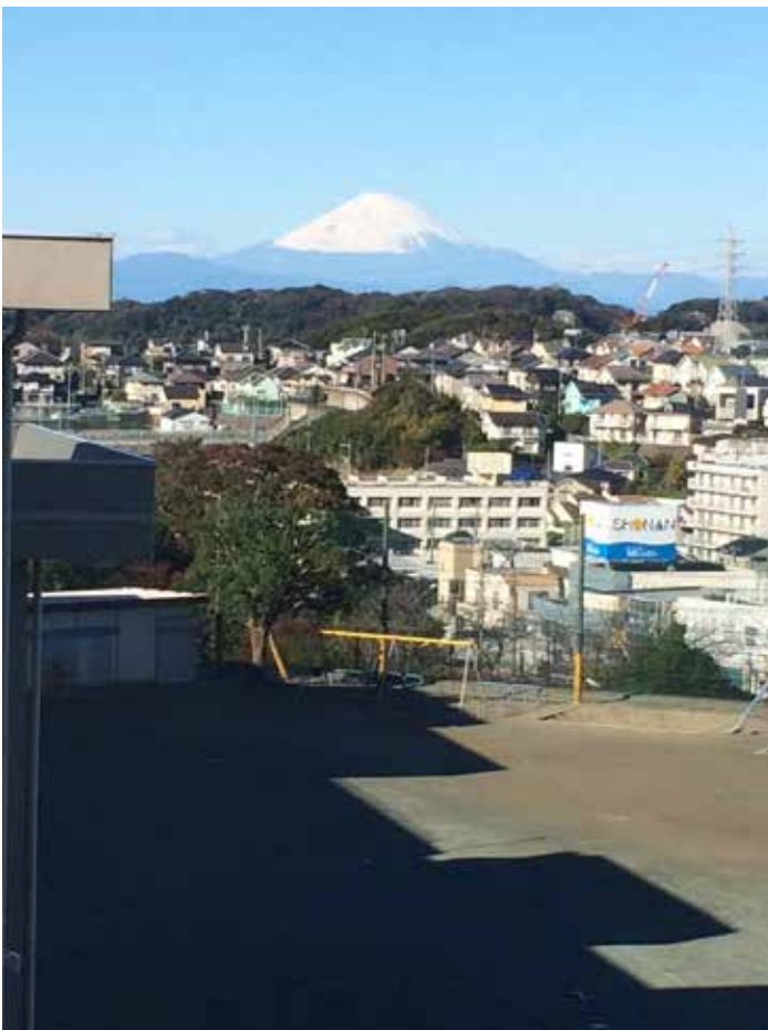
富士見小学校から