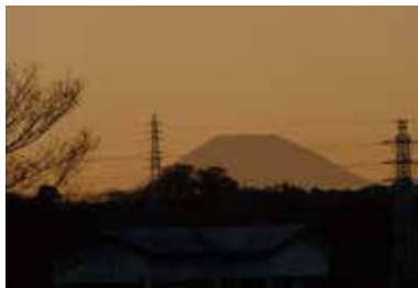
⑤ 浦賀道（大勝利山山頂付近）