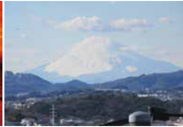
③ 防衛大学校に上がる坂