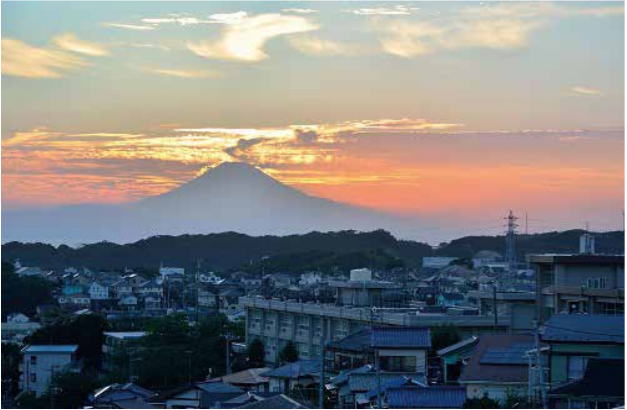
富士見小学校付近から